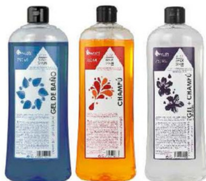
B400GD B400CHD B400GCHD B750GD B750CHD B750GCHD