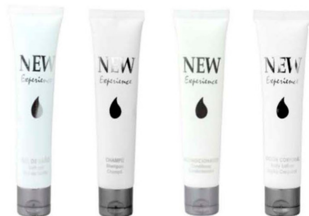
TBGNE30 TBCHNE30 TBANE30 TBLCNE30