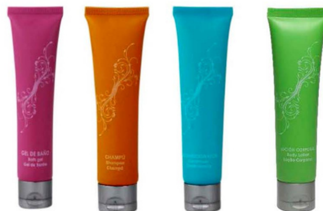
TBGR30 TBCHR30 TBAR30 TBLCR30