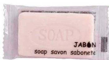
JB0010 - JB0010GR