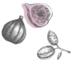
FIG + ALMOND

Perfume que nos traslada a un lugar bajo el sol mediterráneo. El aroma a pulpa de higos, va acompañado por las hojas verdes de la higuera y de fondo la sutileza de las notas lácteas de la almendra que le dan ese toque gourmand.