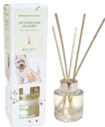
DIFUSOR 50ml COTTON FLOWER / PERRO Ref. 333066.101 - 8412129029053 ↓ 50ml 📦 6u. ⌚ 30d