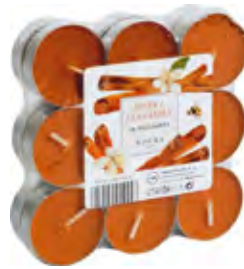
PACK 18 TEALIGHTS