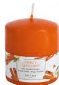
TACO PERFUMADO 80X70