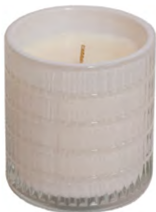
VASO PERFUMADO RELIEVES BLANCO WHITE PEARL

Collection qui respire l'élégance, la classe et la sophistication, un petit luxe pour la maison. Les fragrances sont basées sur des parfums exclusifs de haute parfumerie, afin que leur parfum se répande dans tous les coins de notre maison.