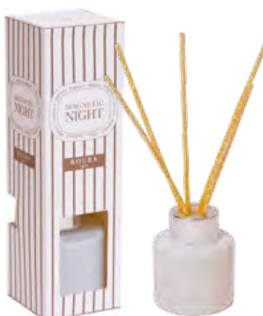
DIFUSOR 50ml MAGNETIC NIGHT