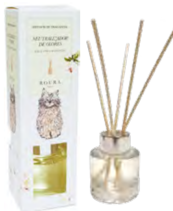
DIFUSOR 50ml WHITE ORCHID / GATO Ref. 333066.102 - 8412129029060 ↓ 50ml 📦 6u. ⌚ 30d