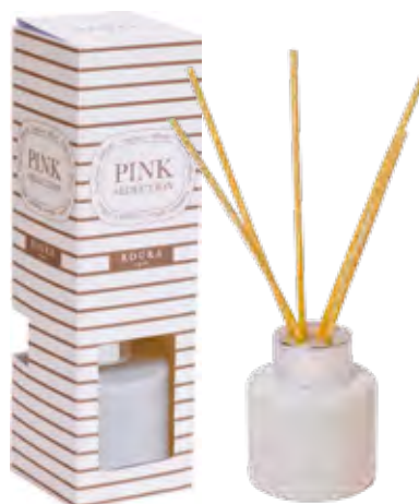
DIFUSOR 50ml PINK SEDUCTION