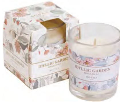
VASO PERFUMADO IDYLLIC GARDEN - ROYAL PEONY Ref. 333480.205 - 8412129032961 ↑ 85xø70mm 📦 6u. ⌚ 30h

Un intenso perfume de pétalos de peonía, combinado con un corazón floral de jazmín junto al frescor del jengibre. Así como notas amaderadas y de almizcles que le otorgan su sofisticación final.