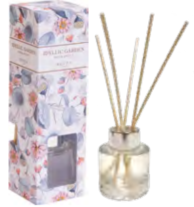
DIFUSOR 50ml IDYLLIC GARDEN - ROYAL PEONY Ref. 333485.205 - 8412129033142 ↑ 50ml 📦 6u. ⌚ 30d