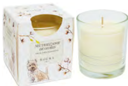
VASO PERFUMADO COTTON FLOWER / PERRO Ref. 330855.101 - 8412129024539 ↓ 75xø70mm 📦 6u. ⌚ 25h

Collection conçue pour neutraliser la mauvaise odeur des nos mascottes. Ces parfums sont à double action: ils parfument avec une agréable odeur de fleur du coton ou d'orchidée blanche et neutralisent la mauvaise odeur au lieu de la masquer.