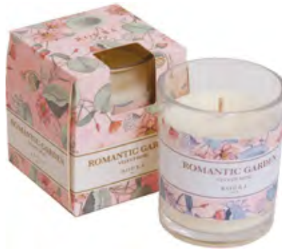
VASO PERFUMADO ROMANTIC GARDEN - VELVET ROSE Ref. 333481.206 - 8412129032978 ↑ 85xø70mm 📦 6u. ⌚ 30h

Una combinación elegante y sofisticada de rosas recién cortadas, suavemente realzada por matices afrutados y de hojas verdes del tallo. Podrás inundarte del aroma aterciopelado de las rosas, que nos aportan frescor, feminidad, calidez y sensualidad.