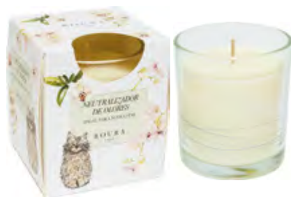
VASO PERFUMADO WHITE ORCHID / GATO Ref. 330855.102 - 8412129024522 ↓ 75xø70mm 📦 6u. ⌚ 25h