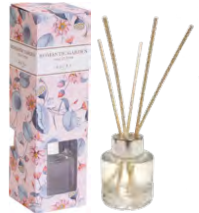
DIFUSOR 50ml ROMANTIC GARDEN - VELVET ROSE Ref. 333486.206 - 8412129033135 ↑ 50ml 📦 6u. ⌚ 30d