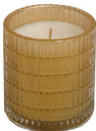
VASO PERFUMADO RELIEVES ORO GOLDEN DIAMOND

Surge de la intensidad de las maderas nobles, suavemente realzado por notas vibrantes de bergamota, incienso y ámbar. Un aroma perfecto para crear un ambiente cálido y acogedor en casa.