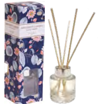
DIFUSOR 50ml MIDNIGHT GARDEN - BLACK ORCHID Ref. 333487.207 - 8412129033159 ↑ 50ml 📦 6u. ⌚ 30d