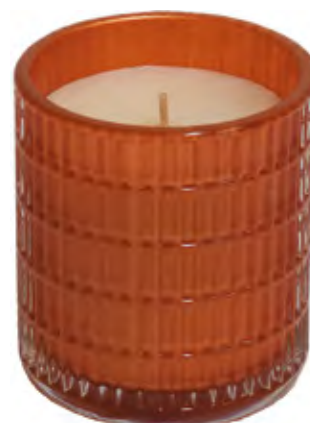
VASO PERFUMADO RELIEVES COBRE COPPERY RUBY

Fragancia vibrante y con identidad propia, predominando el iris de Florencia. Un corazón centrado en el jazmín Sambac y en la esencia del pachulí. De fondo, las notas de caramelo, praliné, grosella y pera, logran una fragancia irrepetible y adictiva.