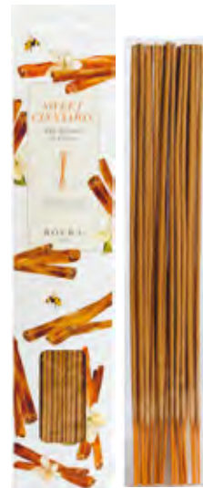
20 VARILLAS INCIENSO