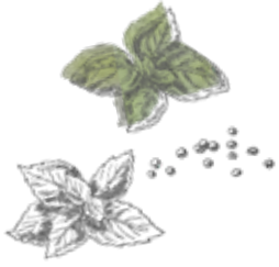
BASIL + PEPPER

Comme son nom l'indique, il s'agit d'une collection, conviviale et respectueuse de l'environnement. Très en ligne avec notre philosophie de réutilisation, en fabriquant des produits qui génèrent un minimum de déchets et sont socialement responsables.