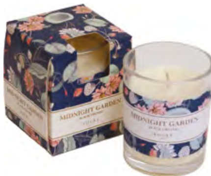
VASO PERFUMADO MIDNIGHT GARDEN - BLACK ORCHID Ref. 333482.207 - 8412129032985 ↑ 85xø70mm 📦 6u. ⌚ 30h

Black Orchid es una fragancia misteriosa de intensas notas verdes y una seductora poción de orquídeas negras y especias dulzonas. Intenso aroma para sentir el frescor del rocío que envuelve a esta fragancia.