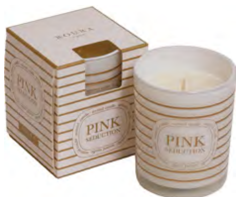
VASO PERFUMADO PINK SEDUCTION

Collection basée sur les reflets dorés du coucher de soleil, dotée de séduction et de pur magnétisme. Des parfums hypnotiques et provocateurs, un style très frais.