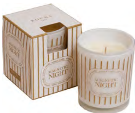
VASO PERFUMADO MAGNETIC NIGHT

Una fragancia seductora, femenina, sensual y apasionada, una base de rosas combinadas con peonía y notas cálidas amaderadas. Una explosión olfativa de lo más pasional.