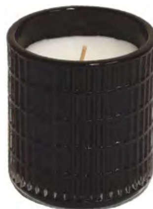
VASO PERFUMADO RELIEVES NEGRO BLACK SAPPHIRE

Es un perfume cálido, envolvente y sensual; todo gracias al intenso jazmín, una flor que cautiva. Fusionado con notas verdes y ligeramente amaderadas, que le aportan una lujosa sofisticación.