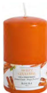
TACO PERFUMADO 100X60