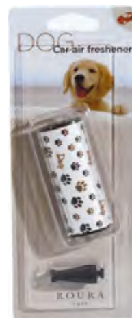
AMBIENTADOR COCHE COTTON FLOWER / PERRO Ref. 395570.101 - 8412129027868 ↓ 68x13mm 📦 12u.